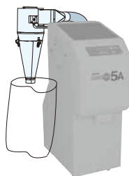
糠サイクロン 〈CY-3Z〉 糠を袋詰め