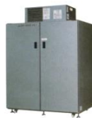
AGR- 850EX・1350EX 平成16-18年 製 (2004~2006年)