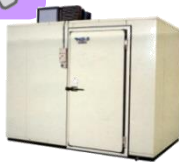
AGR- 2500・ 5000・7500 平成8-17年 製 (1996~2005年)