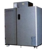
AGR- 1500EX 平成15-18年 製 (2003~2006年)