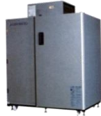
AGR- 800EX 平成15年 製 (2003年)