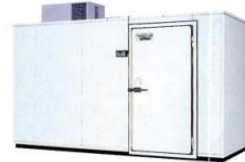
AGR- 10000 平成10-17年 製 (1998~2005年)