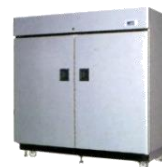
AGR- 24SJ・35SJ 平成18年 製 (2006年)